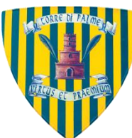
Torre di Palme Colori: Giallo e Verde