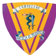
Campolege Colori: Giallo e Fucsia