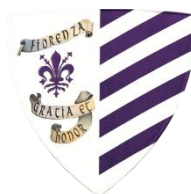
Fiorenza Colori: Viola e Bianco