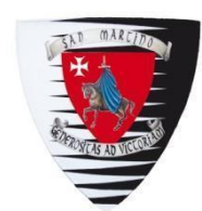
San Martino Colori: Biaco e Nero