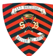
San Bartolomeo Colori: Rosso e Nero