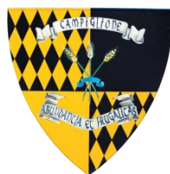
Campiglione Colori: Giallo e nero