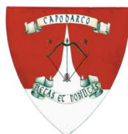
Capodarco Colori: Bianco e Rosso